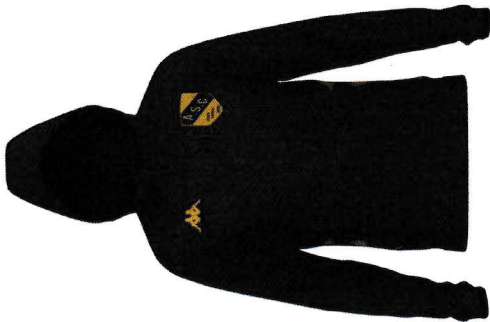
GIORDI SWEAT À CAPUCHE MOLLETON ADULTE (S - M - L - XL - 2XL - 3XL - 4XL) PVC KAPPA : 55€ PVC ASC -30% : 38,50€