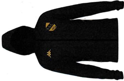
GIORDIZI VESTE ZIPPÉE À CAPUCHE MOLLETON ADULTE (S - M - L - XL - 2XL - 3XL - 4XL) PVC KAPPA : 60€ PVC ASC -30% : 42€