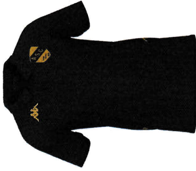
GASTIO POLO EN COTON / POLYESTER ADULTE (S - M - L - XL - 2XL - 3XL - 4XL) PVC KAPPA : 35€ PVC ASC -30% : 24,50€