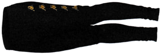
GASCHIN PANTALON DE JOGGING ADULTE (S - M - L - XL - 2XL - 3XL) PVC KAPPA : 45€ PVC ASC -30% : 31,50€